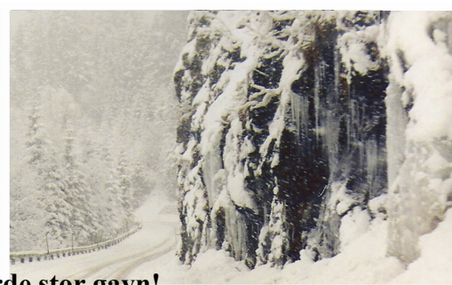
Sneen væltede ned de sidste par dage og snekæderne gjorde stor gavn!