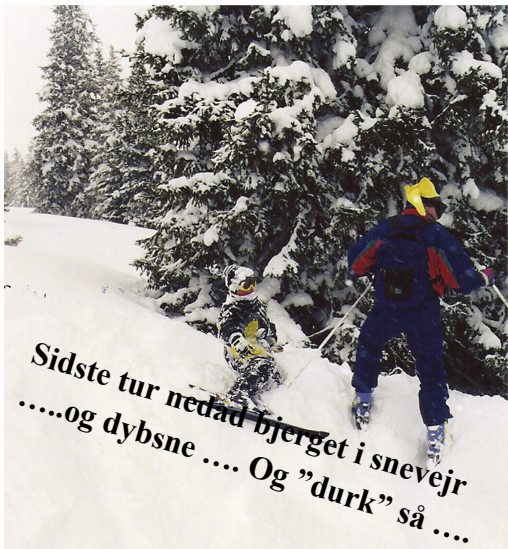
Sidste tur ned ad bjerget i snevejr .....og dybsne .... Og "durk" så ....